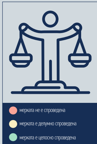
СТЕПЕН НА СПРОВЕДУВАЊЕ НА МЕРКИТЕ